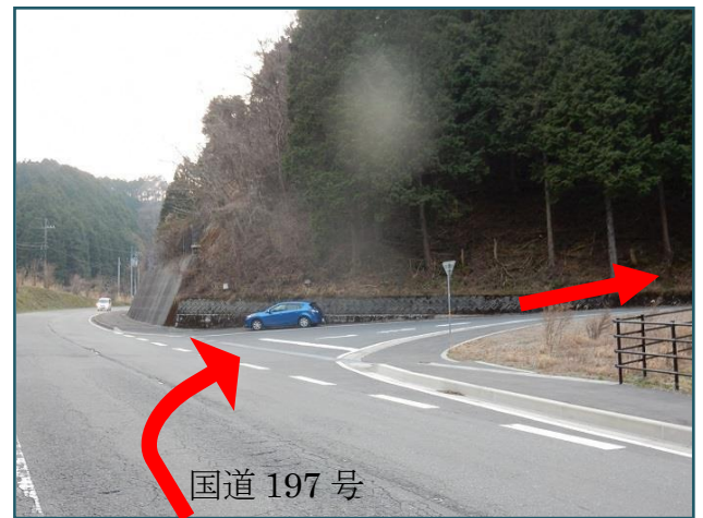
須崎方面から見た交差点

※T字路交差点を右折してください ※壁地トンネルやラーメン豚太郎まで行くと行き過ぎです