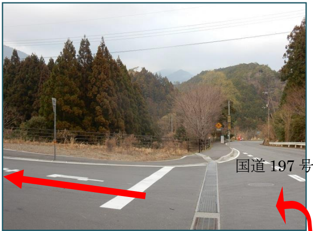
梶原方面から見た交差点